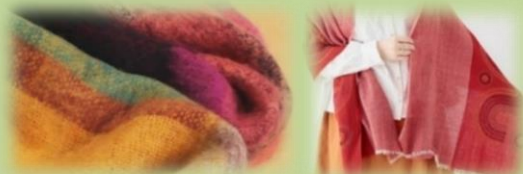
秋冬新作ストールも多数入荷