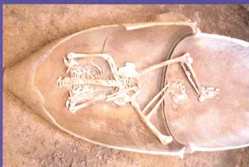
首の無い人骨 (吉野ヶ里遺跡)

11月1日(日)・2日(月)・3日(祝)・22日(日)・23日(月)は通常の発掘現場公開に加え、発掘現場見学会を開催。現場作業員によるガイドも実施。