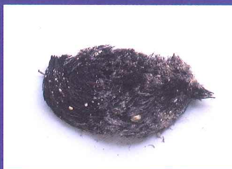
日本最古の髪の毛 (みずら) (吉野ヶ里遺跡)