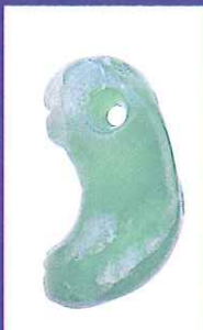
ヒスイの勾玉 (吉野ヶ里遺跡)