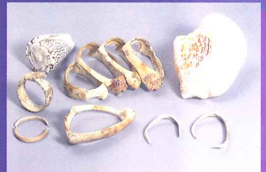
ゴホウラ・イモガイ製腕輪 (吉野ヶ里遺跡)