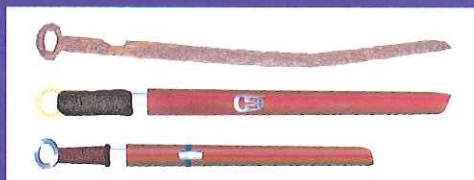
上：素原頭大刀 (横田遺跡) 下：漢代の大刀 (イラスト)