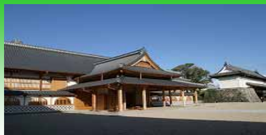
佐賀城本丸歴史館