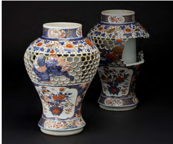
五彩・色絵花卉文碗皿(破片) 景德鎮窯・有田窯 18世紀前半 ロースドルフ城蔵

オーストリア、ウィーン近郊にたたずむ古城ロースドルフ城では、城主ピアッティ家により古伊万里を中心とした陶磁器が多数コレクションされ、城内を美しく飾る調度品として大切に伝えられてきました。ところが、第二次世界大戦の戦禍によりその多くが破壊されてしまいました。ピアッティ家はそうした悲劇により破壊された陶片を破棄せず、城内の一室に陶片を集め、平和への願いも込めてインスタレーション展示を行い一般公開してきました。本展は、国内にある古伊万里の名品とともに、破壊された陶片を含むロースドルフ城所蔵の日本、中国、西洋の陶磁器コレクションを海外において初公開するものです。日本の修復技術による復元作品も展示し「再生」にも焦点を当て、波乱に富んだロースドルフ城コレクションの全貌を紹介します。