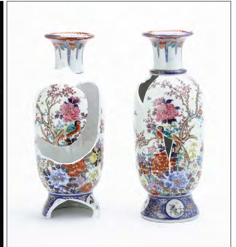
左から 色絵唐獅子牡丹文亀甲透彫瓶(部分修復) 有田窯 1700-1730年代 ロースドルフ城蔵 / 白磁大壺(組み上げ修復) マイセン窯 20世紀初頭 ロースドルフ城蔵 / 色絵花卉文花瓶(組み上げ修復) 有田窯 19世紀後半 ロースドルフ城蔵